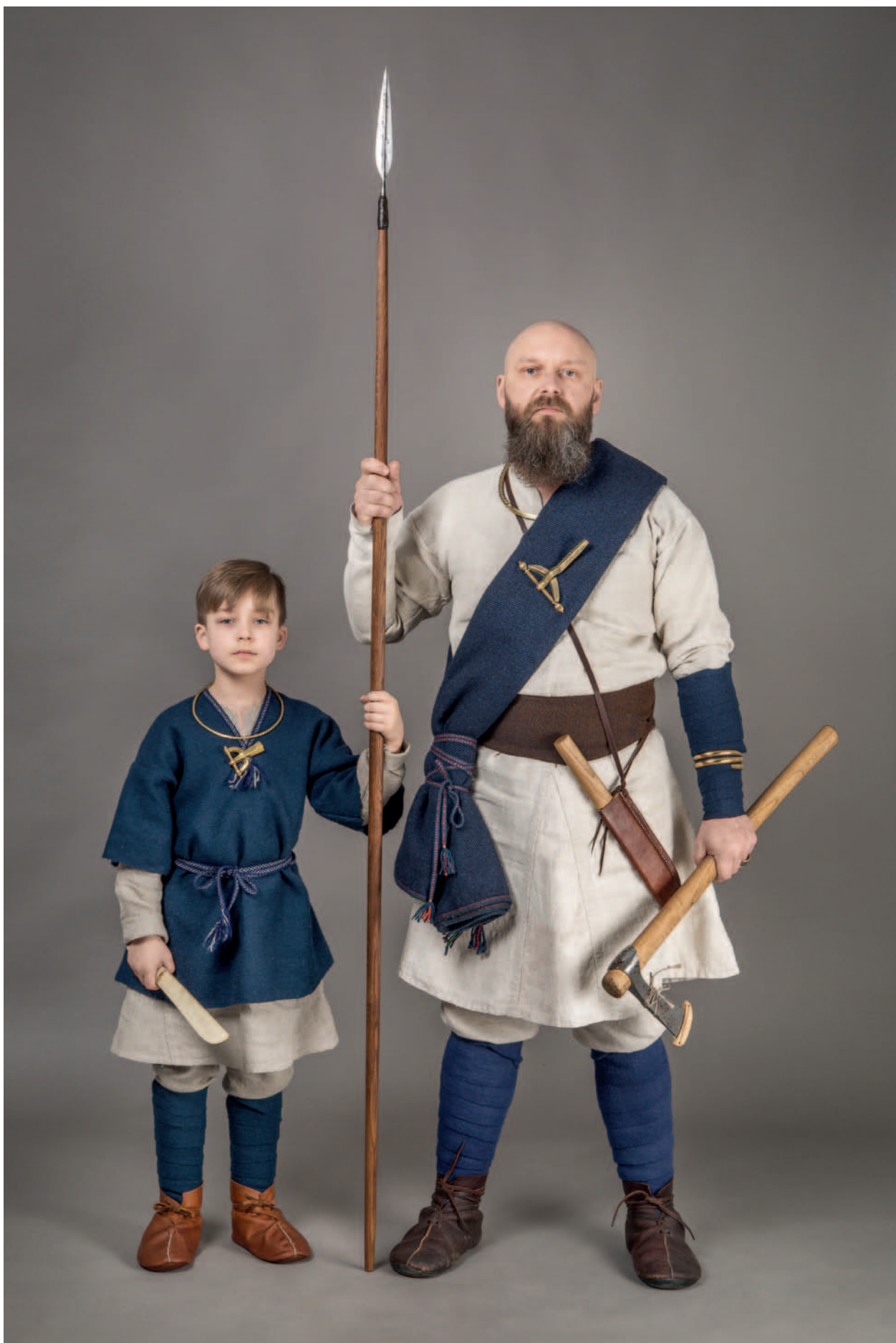
Berņiuko ir vyro kostiumai, rekonstruoti pagal VIII-IX a. Jauneikių (Joniškio r.) kapinyno medžiagą. Rekonstrukcijų autoriai — asociacijos nariai.