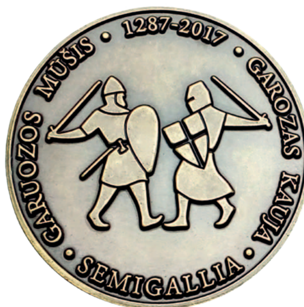
Atminimo medalis, skirtas Garuozos mūšio 730 m. sukakčiai.

Istoriškai taip susiklostė, kad Žiemgala negali pasigirti piliakalnių gausumu, nes krašto teritoriją iš esmės sudaro monotoniškos lygumos. Natūralių kalvų joje nedaug, todėl įrengti aukštesnius, gerai įtvirtintus piliakalnius reikėjo žymiai daugiau pastangų nei kituose regionuose.