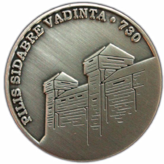
Atminimo medalis, skirtas Sidabrės pilies paminėjimo rašytiniuose šaltiniuose 730 m. sukakčiai.

Žiemgaliai, pasak metraštininko Henriko Latvio, negyvenę taikoje ir su lyviais. Tikėtina, kad būta teritorinių konfliktų, kad jie konkuravo dėl prekybos bei įtakos Rygos įlankoje. Na, o nupjautų lietuvių karių galvų demonstravimas Žiemgaloje, ko gero, puikiausiai atspindi ankstyvuosius žiemgalių santykius su Lietuva. Juk galvų kapojimas – labai senas karo paprotys. Yra žinoma, kad romėnai fortų vartus puošdavo nukautų neeilinių keltų galvomis. Tie patys keltai arba germanai nugalėtų priešų galvas laikydavo prie įėjimo į namus ar net menėse. Eiliuotoje Livonijos kronikoje minimi ne kartą prieš žiemgalius žygiavę latgaliai ir kuršiai. Bet tai jau vokiečių vykdytos žemių užkariavimo politikos rezultatas, skatinęs žiemgalius ieškoti naujų sąjungininkų. Jais buvo lietuviai arba „lietuviai, vadinami