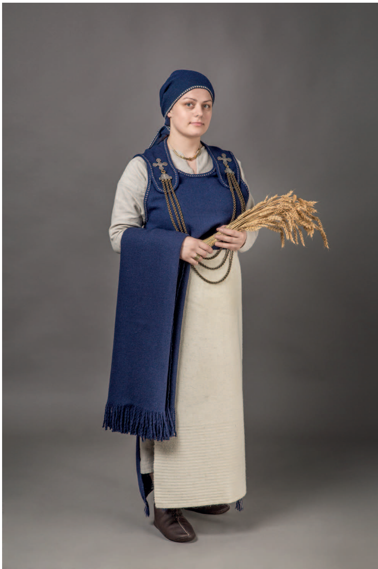
Moters kostiumas, rekonstruotas pagal VII–VIII a. Kurmaičių–Linksmėnų (Joniškio r) kapinyno medžiagą.