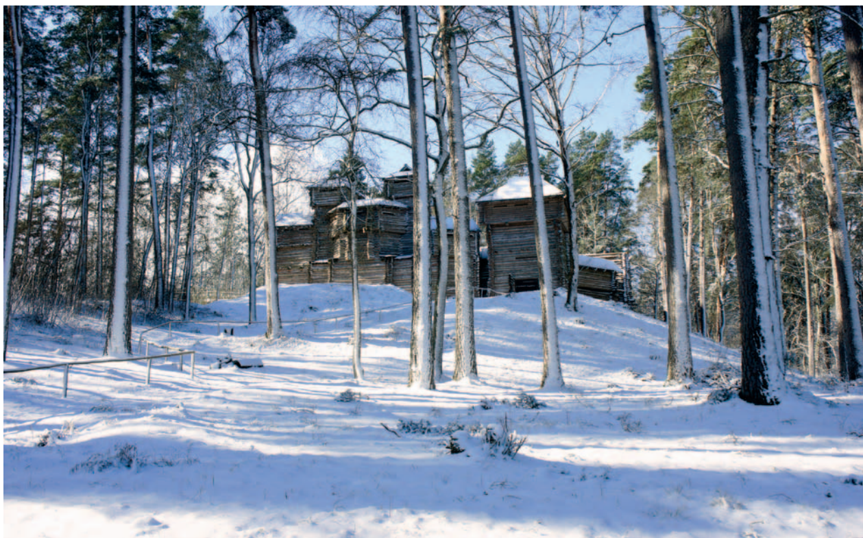
XII–XIII a. medinės pilies rekonstrukcija Tervetėje.

O tie patys komturai ir broliai visiškai sunaikino krikščionišką Žiemgalos žemės tautą, turinčią tikruosius vyskupą ir kunigus, kurie jiems bažnytinius sakramentus teikė; jie išžudė tos pačios žemės kilmingesnius, kuriuos į vaišes buvo pasikvietę, neapsakomos išdavystės žiaurumu, nukapodami galvas; žiauriai išvarė likusią minėtos žemės tautos daugybę, daugiau negu šimtą tūkstančių abiejų lyčių tikinčiųjų į pagonių žemes, ir minėti tikintieji buvo atiduoti amžinai vergystei tiems patiems pagonims, [mūsų] tikėjimo priešpatai. Todėl Žiemgalos vyskupija, kuri buvo septynių dienų žygio platumo, buvo visiškai išvalyta nuo kitų krikščionių. (Rowell 2003, 272–283).