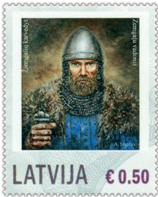
Riboto tiražo pašto ženklas su rašytiniuose šaltiniuose neįvardinto Garuozos mūšyje žuvusio žiemgalių karvedžio imaginaciniu portretu.