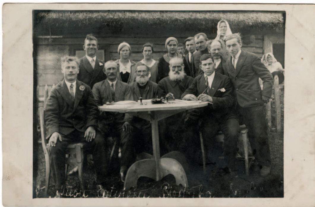
Vismantniekai – Vismantų latvių bibliotekos draugija.

Pažintį su Žiemgala pradėjau gana neįprastu būdu – per sunkiąją metalo muziką. Mūsų krašte buvo savaimė suprantamas dalykas, kad esame nei žemaičiai, nei aukštaičiai. Gerai – skerslatviai , iš dalies tai mums tiko, bet giliai pasąmonėje užsifiksavirusio raktinio Žiemgalos termino prasmės iškojau domėdamasis istorija ir archeologija. 2004 m. kartu su bendraminčiais iš Joniščio įkūrėme istorijos klubą, kuris glaudėsi po